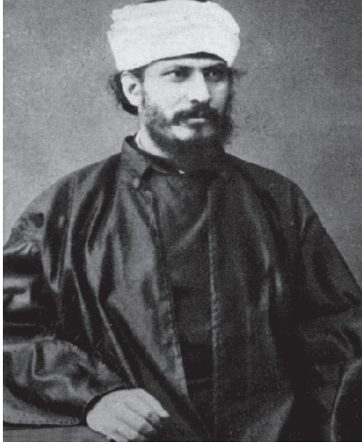
جمال الدين الأفغاني.